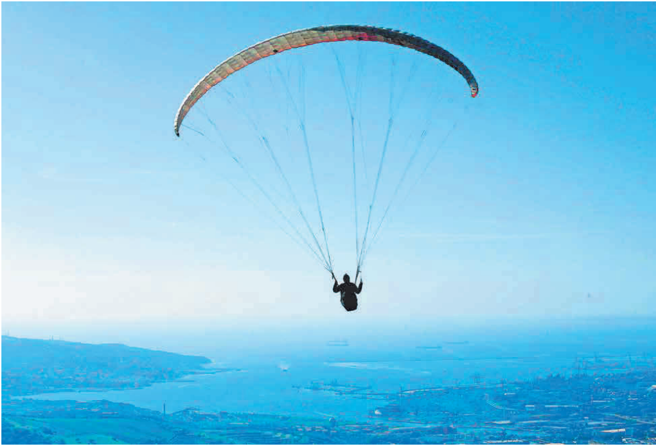
Pred 70 leti je prenehalo obstajati Svobodno tržaško ozemlje.