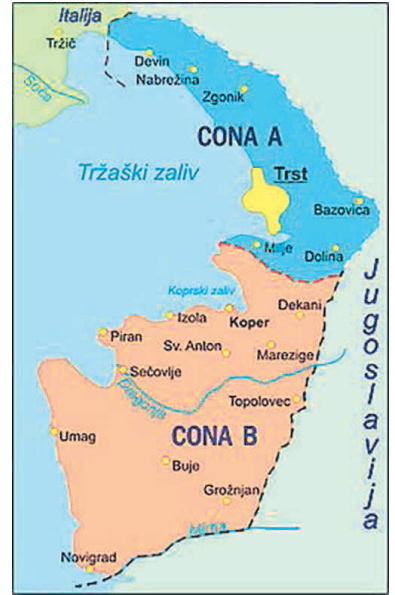
5 pariško mirovno pogodbo sta območje tržaške pokrajine (danes imenovane Juljska medobčinska zveza) s Trstom, ki je predstavljal novo cono A, in severni del Istre – od Koprca do Novigrada –, torej cona B, postala nova državna entiteta, in sicer Svobodno tržaško ozemlje (STO).